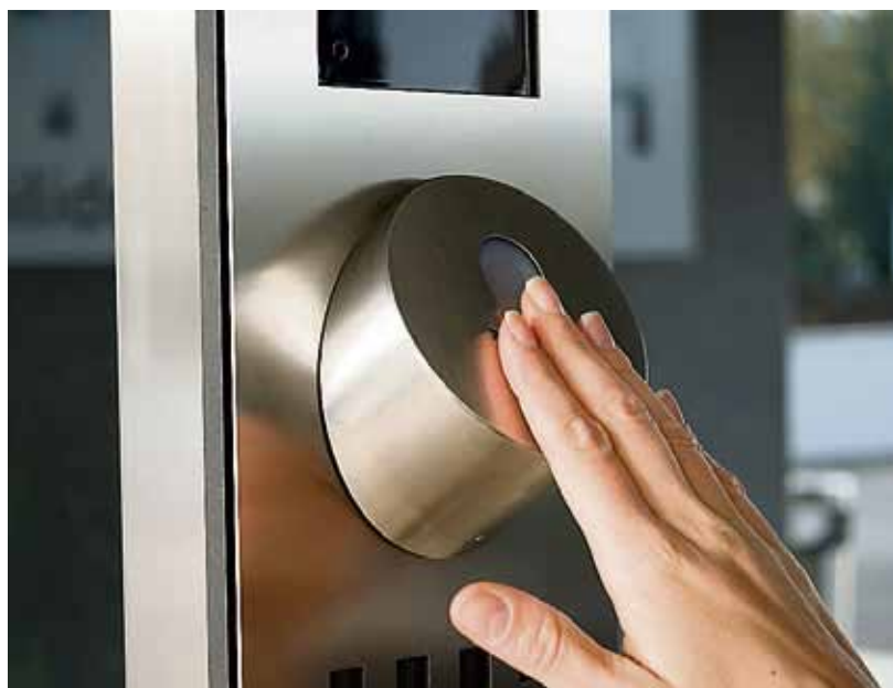
Dieses System speichert die Daten des Fingerabdrucks und öffnet die Türe nur, wenn sie mit den Daten auf dem Server übereinstimmen.

Scanner den Fingerabdruck und vergleicht ihn mit den im System hinterlegten Daten und Angaben. Danach lässt sich die Türe öffnen. Das Schlüsselsuchen gehört mit einer solchen Anlage endgültig der Vergangenheit an.