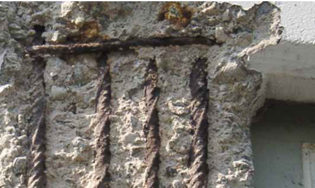
Im Schweizer Hochbau wurden 2011 rund 21 Mrd. CHF verbaut. Davon mussten 1,6 Mrd. CHF in die Mängelbehebung investiert werden.

ZU WENIG PLANUNG UND KONTROLLE. Ein weiterer Grund für Mängel sind der Preis- und Zeitdruck auf der Baustelle. Nicht selten werden diesen Randbedingungen die Bauqualität und die längerfristige Werterhaltung einer Immobilie untergeordnet. So bildet der Preis oftmals das Hauptkriterium für die Vergabe von Ar-